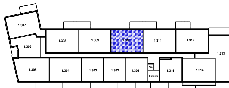
Situation du Logement