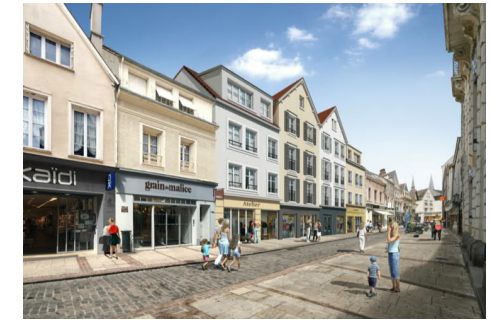
SCI du Farmin

42,44, et 44 bis, Rue Noël Ballay 5 bis, 7 et 9, Rue Famin 28000 Chartres