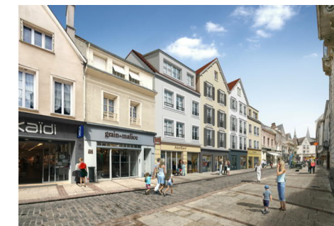
SCI du Farmin

42,44, et 44 bis, Rue Noël Ballay 5 bis, 7 et 9, Rue Famin 28000 Chartres