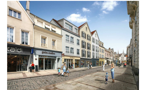
SCI du Farmin

42,44, et 44 bis, Rue Noël Ballay 5 bis, 7 et 9, Rue Famin 28000 Chartres