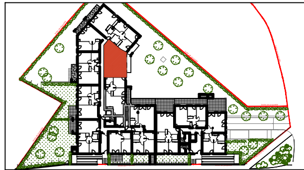
PLAN DE REPERAGE